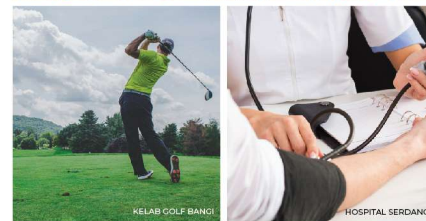
KELAB GOLF BANGI